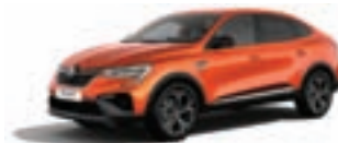
RENAULT MEGANE CONQUEST R.S. Line TCe 140 EDC Bose ozvočenje