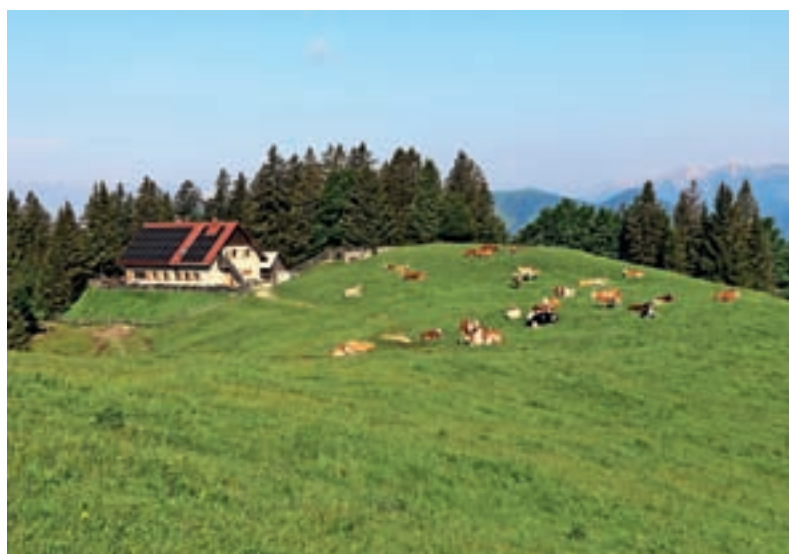
Sonce je glavni vir energije na Blegošu.