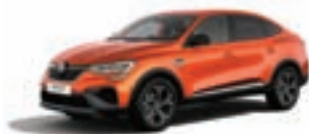
RENAULT MEGANE CONQUEST R.S. Line TCe 140 EDC