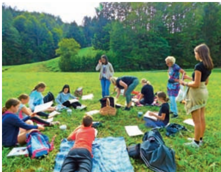
Bralno-ustvarjalno popoldne

Šestnajsti oktober velja za svetovni dan oživljanja. Več učiteljev in vzgojiteljev se je izobraževalo za posredovanje v primeru