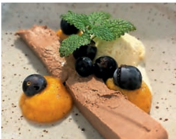
Martinova sladica

V petek pred martinovim smo v Dvorcu Visoko počastili praznik sv. Martina.