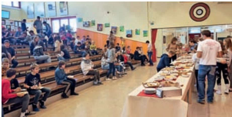
Tradicionalni slovenski zajtrk v OŠ Ivana Tavčarja Gorenja vas