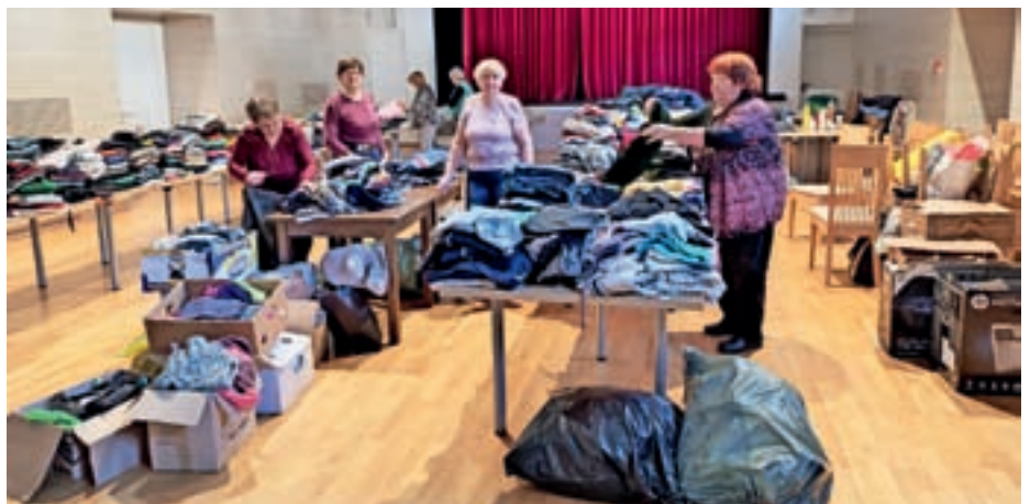
Tudi na jesensko zbiralno akcijo so se občani zelo dobro odzvali, prostovoljke pa so dežurale ves dan.