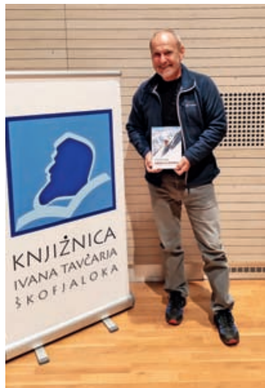
Viki Grošelj z novo knjigo

V začetku novembra je v veliki dvorani Sokolskega doma potekala prva javna predstavitev nove knjige Vikija Grošlja z naslovom Mojih 33 odprav v najvišja in najbolj odmaknjena gorstva sveta. Viki Grošelj, vrhunski alpinist, himalajec, gorski reševalec in gorski vodnik je Slovenec z največ preplezanimi osemti-sočaki in prvi Slovenec, ki se je povzpел na najvišje vrhove vseh celin. Na svojo prvo odpravo se je podal leta 1975, ko so se s prijatelji povzpeli na vrh Makaluja. Ta vzpon je predstavljal pomembno prelomnico v njegovem alpinističnem udejstvovanju. Na vrhu sta ga redki zrak in hud mrz tako prevzela, da si