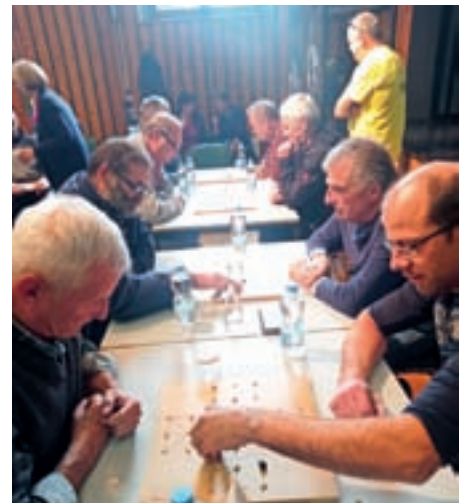
Prvi turnir v igranju vovkalce na Sovodnju

je z dvema volkovoma uspelo pojesti več kot devet ovac. Pastir ovac pa je zmagal, če je prignal v hlev devet ovac. Pod budnim očesom komisije so tekmovalci zbrano igrali po pravilih, ki so jim bila znana že vnaprej. Preostali obiskovalci so navijali za izbrane kandidate. Nekateri so v »vovkalc« odigrali tudi prijateljske partije med seboj. Po dveh igrah so si tekmovalci privoščili nekaj oddiha. Takrat so tri učence Podružnične šole Sovodenj prikazale pripravo testa in izdelavo drobnjakovih štrukeljcev. Preprosti in nasitni »drobnjakovi štrukli na žup« so bili včasih pogosto na jedilniku po naših vaseh in na širšem škofjeloškem območju. Danes se izdelava štrukljev nekoliko razlikuje po krajih ter sodobnih težnjah gospodinj in jedcev. Učenci so v lanskem šolskem letu o poznavanju in pripravi te hrane doma izvedli anketo, letos pa bodo vse skupaj