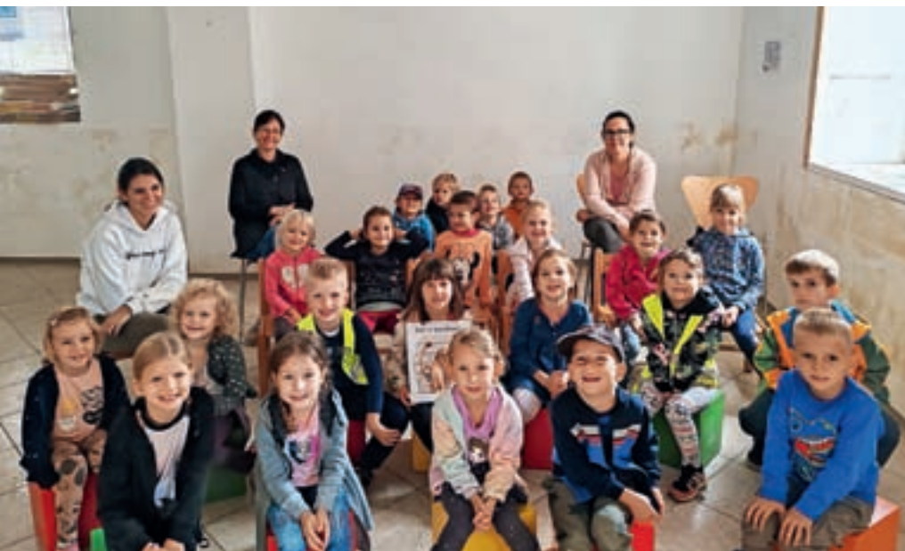
Otroci iz vrtca Agata v poplavljenih prostorih

Škofja Loka z okolico je dobila edinstveno knjigo, ki jo ima le malokateri kraj. Avtorji so prebivalci naših krajev, ki so v stoletjih v ljudski spomin zapisovali dogajanja na tem koščku zemlje. Knjiga prinaša ljudske pripovedi, pesmi, šege in pregovore v Škofji Loki z okolico ter v Poljanski in Selški dolini. Dodano je še poglavje o vsakdanji in praznični mizi na Škofjeloškem. Predstavitev knjige bo v torek, 12. decembra, ob 18. uri v veliki dvorani v Sokolskem domu v Gorenji vasi.