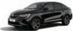
RENAULT MEGANE CONQUEST R.S. Line TCe 140 EDC