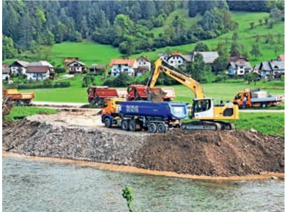
Dela, ki jih direkcija za vode izvaja v naselju Poljane

Kot so pojasnili na direkciji, se omenjeni izredni ukrepi izvajajo za odvrnitev neposredne nevarnosti za življenje ali zdravje ljudi ali premoženja. »Gre za ukrepe na vodnih, priobalnih in drugih zemljiščih ter vodni infrastrukturi, s katerimi se prepreči povečanje posledic škodljivega delovanja voda. V sklopu izrednih