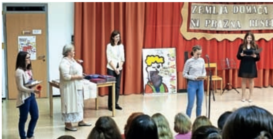
Na prireditvi v avli Osnovne šole Ivana Tavčarja Gorenja vas so najboljšim ustvarjalcem podelili nagrade in priznanja.