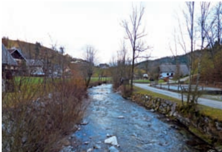
Hotaveljščica ali rivulus Cotabla je prvi zapisani toponim z območja gorenjevaško-poljanske občine.

V okviru Freisinškega fevdalnega gospodstva se je oblikovala upravna razdelitev na manjše enote, imenovane uradi, med ljudstvom pa se je zanje uveljavil izraz župa. Danes bi jih lahko imenovali občine. Takšno samostojno občino so imele tudi Hotavlje, imenovala se je Hotaveljska župa, obstajala pa je več stoletij, vse do konca fevdalne ureditve. Skupaj s kraji, ki ji pripadajo, jo omenja že urbar loškega gospodstva iz leta 1291, kjer so Hotavlje poimenovane Chotaeuel. Ozemeljsko je obsegala današnje kraje: Čabrače, Debeni, Fužine, Hlavče Njive, Hobovše, Hotavlje, Kopačnica, Krnice, Lajše, Laze, Leskoviča, Podgora, Robidnica, Srednje Brdo, Studor, Suša, Trebija in Volaka. Ob popisu prebivalstva leta 1780 je na ozemlju župe v omenjenih naseljih v 285 hišah živelo 1690 ljudi, leta 1817 pa v 309 hišah 1698 ljudi. Hotavlje so bile pomemben kraj na srednjeveški poti, ki je povezovala Škofjo Loko skozi Poljansko dolino s tolimskim