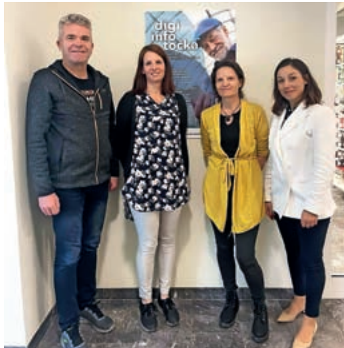
Odprtje Digi info točke v Gorenji vasi

Doslej so odprli 160 tovrstnih točk po vsej Sloveniji. »Svetovanje na Digi info točki pokriva različna področja digitalnih javnih storitev, vključno z uporabo elektronske osebne izkaznice, povezanimi mobilnimi aplikacijami, prijavo v elektronske storitve, elektronskim podpisovanjem, dostopom do informacij o delovanju državne uprave prek portala gov.si ter uporabo storitev portala eUprava, SPOT, eDavki ... To so le nekatera izmed področij, kjer bodo občanom na voljo strokovnjaki.« Digi info točka v Občini Gorenja vas - Poljane bo odprta pet dni na teden, in sicer v torek, četrtek in petek od 7. do 11. ure ter v ponedeljek in sredo od 12. do 15. ure.