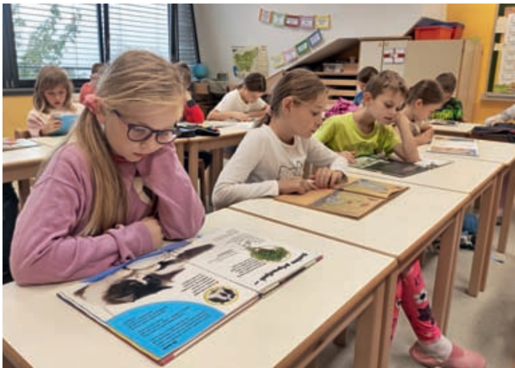
Bralne minutke spodbujajo k branju.