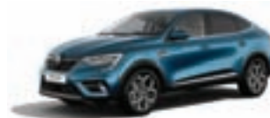
RENAULT MEGANE CONQUEST Techno TCe 140 EDC*