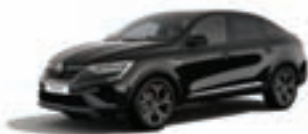
RENAULT MEGANE CONQUEST R.S. Line TCe 140 EDC