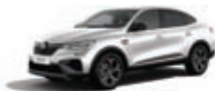
RENAULT MEGANE CONQUEST R.S. Line TCe 140 EDC