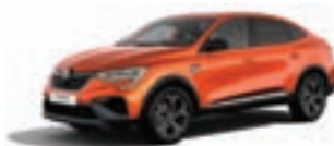
RENAULT MEGANE CONQUEST R.S. Line TCe 160 EDC