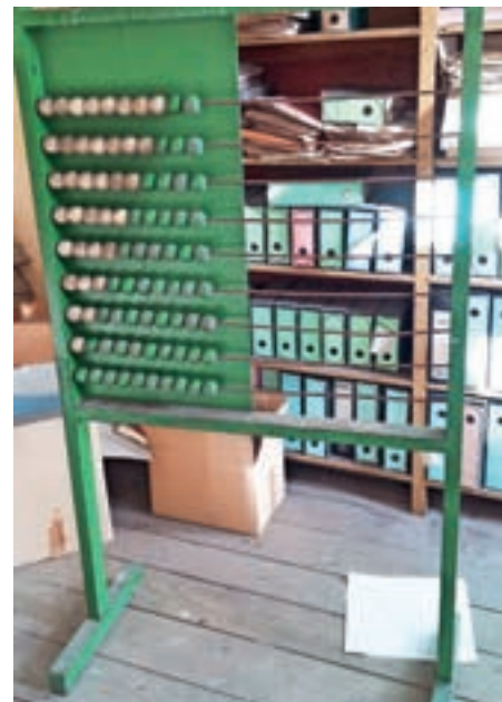
Na preprostem, a učinkovitem računalu so se pred desetletji otroci učili osnov matematike.

Gorenja vas z okoliškimi šolami v Loških razgledih: šolski okoliš ljudske šole na Trati je zajemal otroke iz 14 vasi: Trata, Sestranska vas, Gorenja vas, Dolenja Dobrava, Gorenja Dobrava, Todraž, Hota-vlje, Hlavče Njive, Srednje Brdo, Žirovski Vrh Sv. Antona, Žirovski Vrh Sv. Urbana, Bačne (razen hišnih št. 3, 4, 5, 7), Čabrače in Volaka. Šolski upravitelj je imel v šoli svoje stanovanje s tremi sobami, kuhinjo in jedilno shrambo. Šola je imela tudi šolski vrt in igrišče. Otroke so poleg klasičnih šolskih predmetov in verouka učili tudi različnih ročnih del in sadjarstva. Za pouk matematike so v tratarski šoli v nižjih razredih uporabljali leseno tablo s preprostim mehanskim računalom v obliki lesenih barvnih kroglic na kovinskih palicah. Tabla se je ohranila na podstrešju stare šole vse do rušenja zgornje etaže ob prezidavi objekta, ko je bila zaupana v hrambo osnovni šoli v Gorenji vasi.